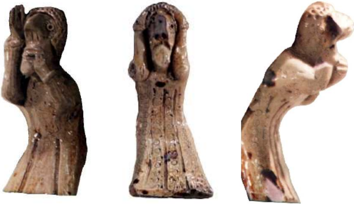
Abb. 13-15: Männergestalten auf den Füßen

tung, dass es sich um ein Gefäß zur Herstellung eines Hexen- oder Zaubertrunkes handeln könnte, ohne diesen aber näher zu beschreiben. Mehrfach wurde vermutet, dass es sich bei dem Gebräu aus dem Gefäß um einen Liebestrunk, also ein aphrodisierendes Getränk handeln könnte, wobei wiederum die Gestensymbolik eine Rolle spielt. Diese Symbolik des „Nichts sehen – nicht hören – nichts sagen“ ließ einen weiteren Besucher an gewisse Freimaurerlogen denken, bei denen gerade diese Symbole eine wichtige, auch ikonographische Bedeutung hatten, was ihn wiederum dazu veranlasste, das Objekt als ein Gefäß für rituelle Handlungen der Freimaurer zu bezeichnen.