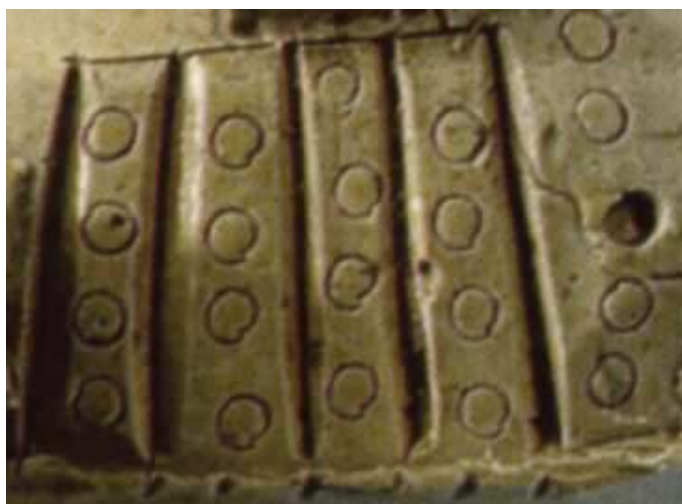
Abb. 10 (oben): abgebrochener Hals mit Resten eines Zinnenkranzes; Abb. 11 (Mitte): Stempelverzierungen auf beschnittenem Gefäßkörper; Abb. 12 (unten): Drachen-/Echsenkörper auf den Henkeln