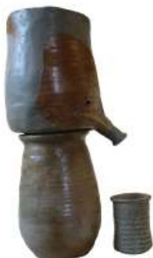
Abb. 8: Komplette Destilliervorrichtung aus Raereener Steinzeug

nicht vorgenommen werden. Zeitlich ist die Raereener Destilliervorrichtung auf die erste Hälfte des 16. Jahrhunderts einzuschätzen. Es handelt sich um das einzige bekannte derartige Objekt aus Rheinischem Steinzeug.