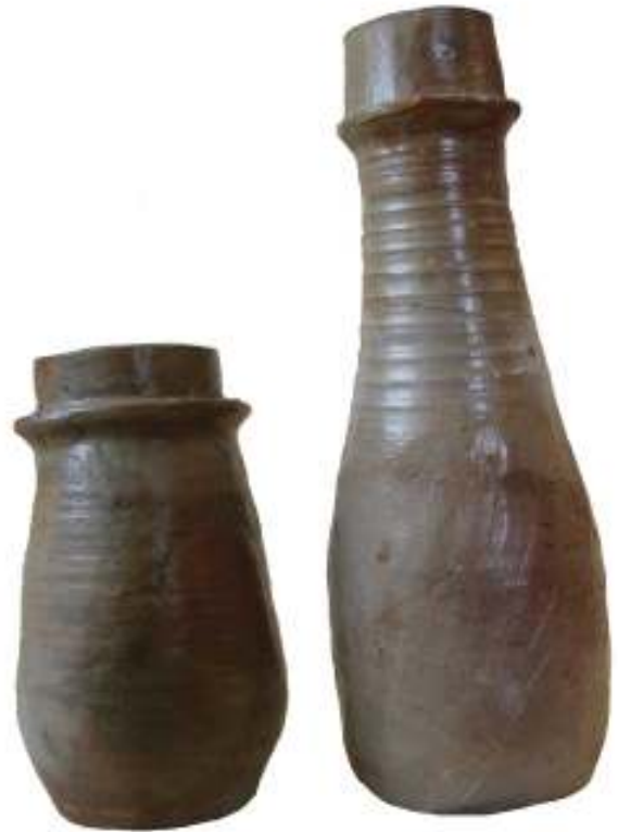
Abb. 3: Zwei Flaschen mit breit auskragendem Wulst, Steinzeug (Töpfereimuseum Raeren, Inv. Nr. 2030 und 2031)

zeitischen Fachkreisen verbreitet und in Belgien nicht zugänglich war, machte für das Töpfereimuseum Raeren erst ein Besuch von Kollegen des Nationalen Genvermuseums in Hasselt (B) im Jahre 1998 die genauen Funktionszusammenhänge des Gesamtkomplexes deutlich. Tatsächlich handelt es sich um eine komplette Destilliervorrichtung, wie sie in Alchemistenlabors aber auch bei der Produktion von hochprozentigen Getränken zum Einsatz kam. Der Prozess des Destillierens oder auch Fixierens (das „Festmachen“ flüchtiger Körper) ist bereits in frühen griechischen alchemischen Texten beschrieben und teilweise mit Zeichnungen versehen 4 . Aus der Frühzeit der Alchemie, etwa ab dem 1. Jh. nach Christus, stammt der Alembik, auch Ambix, Kopf oder Helm genannt, der bis zum 18. Jahrhundert Verwendung fand 5 .