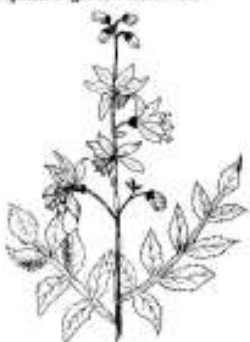
Diptam origanum dictamnus