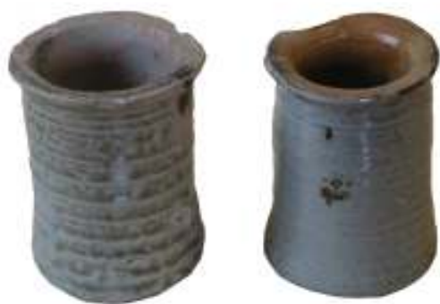
Abb. 4: Zwei Becher mit breit auskragendem Mündungsrand, Steinzeug (Töpfereimuseum Raeren. Inv. Nr. 5044 und 5045)

einfachen Alembiks 9 . Es handelt sich dabei um einen Destillierhelm, der von einem Wasserbecken umgeben ist und in den permanent kaltes Wasser nachgefüllt wird 10 , wie ein anonymer Kupferstich aus dem Jahre 1625 zeigt (Abb. 6).