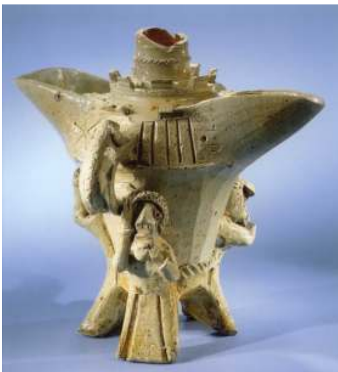
Abb. 9: Gefäß aus dem Rijksmuseum Amsterdam (Inv. Nr. BK-NM-1448)

Siebes abgedeckt sind. Die beiden runden Henkel, vergleichbar denen von Aquamaniles, sind jeweils mit einem aufmodellierten Drachen- oder Echsenkörper verziert (Abb. 12). Die drei lang auslaufenden Füße tragen als Dekoration jeweils eine menschliche Gestalt mit ausdrucksvollem, erschrockenem Minenspiel. Eine der Figuren verdeckt die Augen mit den Händen, die zweite hält sich den Mund zu, die dritte die Ohren (Abb. 13-15). Am oberen Teil des Gefäßes sind Reste eines Zinnenkranzes zu sehen, dazwischen ragt der Rest eines gedrehten und mit modelliertem Zierband versehenen Halses auf (Abb. 10). Der obere Teil des Gefäßes ist leider nicht erhalten und sind weder die originale Höhe noch die Ausformung des Oberteils oder gar weitere Dekorationselemente erhalten geblieben.