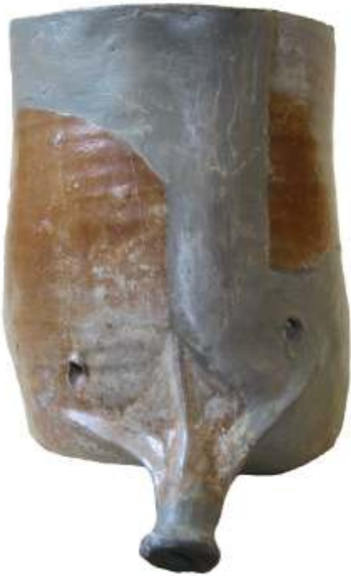
Abb. 2: Mohrenkopf aus Raerener Steinzeug (Töpfereimuseum Raeren, Inv. Nr. 5030)