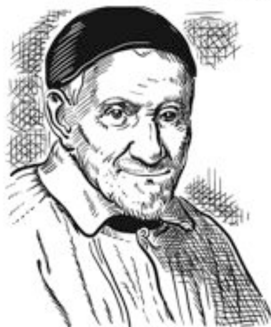
Vinzenz von Paul